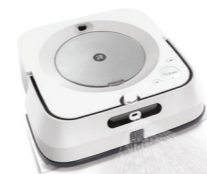
Braava jet® m6

Най-добрият робот моп с прецизен разпръсквач