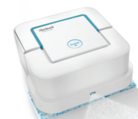
Braava jet® 240

Най-добрият робот моп с прецизен разпръсквач